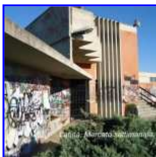
Latina, Area del Mercato (2)